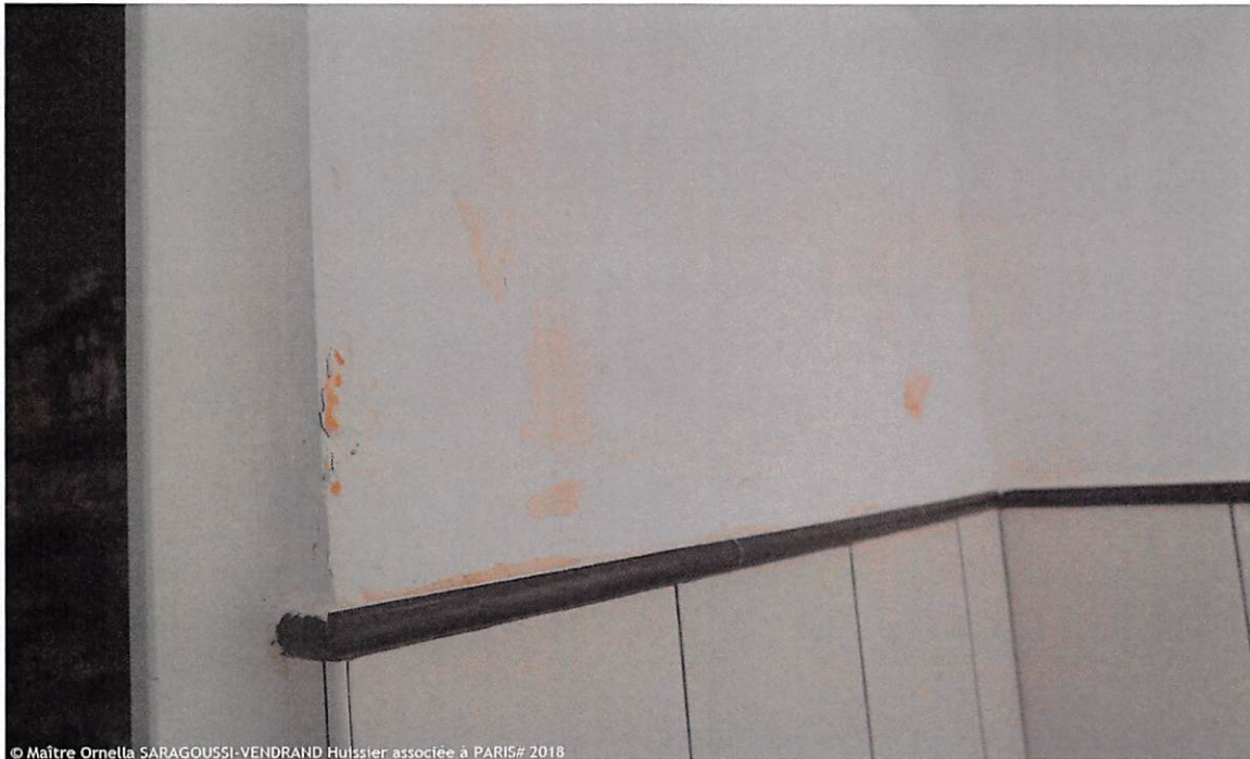
© Maître Ornella SARAGOUSSI-VENDRAND Huissier associée à PARIS# 2018