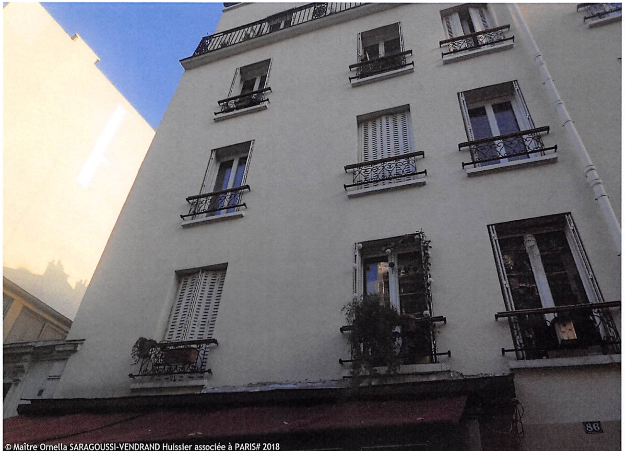
© Maître Ornella SARAGOUSSI-VENDRAND Huissier associée à PARIS# 2018