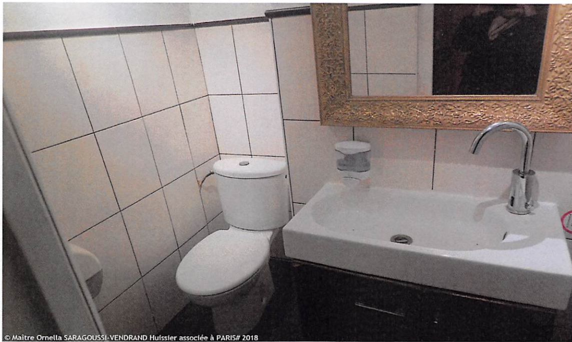
© Maître Ornella SARAGOUSSI-VENDRAND Huissier associée à PARIS# 2018