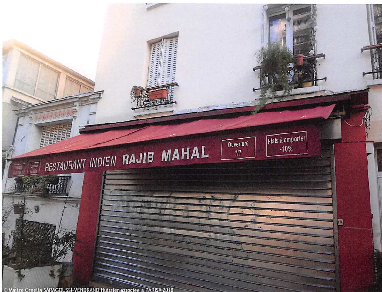
© Maître Ornella SARAGOUSSI-VENDRAND Huissier associée à PARIS# 2018

Ornella SARAGOUSSI-VENDRAND Huissier de Justice 8 rue de Ventadour 75001 PARIS