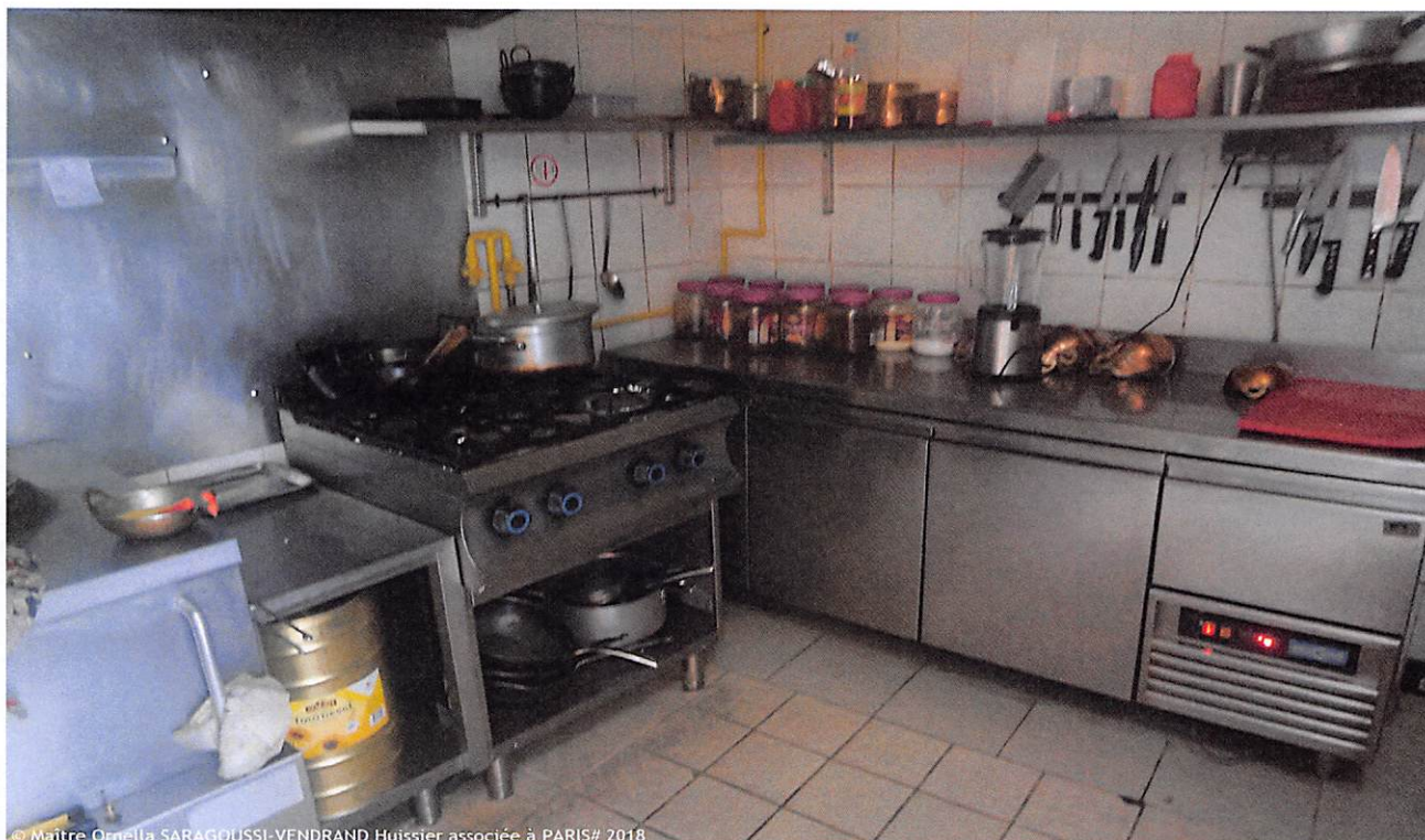
© Maître Ornella SARAGOUSSI-VENDRAND Huissier associée à PARIS# 2018

Je constate qu'il y a une petite fenêtre en plafond, le tout est dans un état très sale.