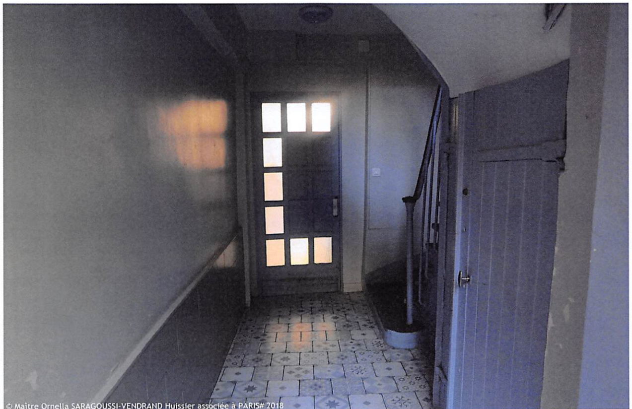
© Maître Ornella SARAGOUSSI-VENDRAND Huissier associée à PARIS# 2018

Ornella SARAGOUSSI-VENDRAND Huissier de Justice 8 rue de Ventadour 75001 PARIS