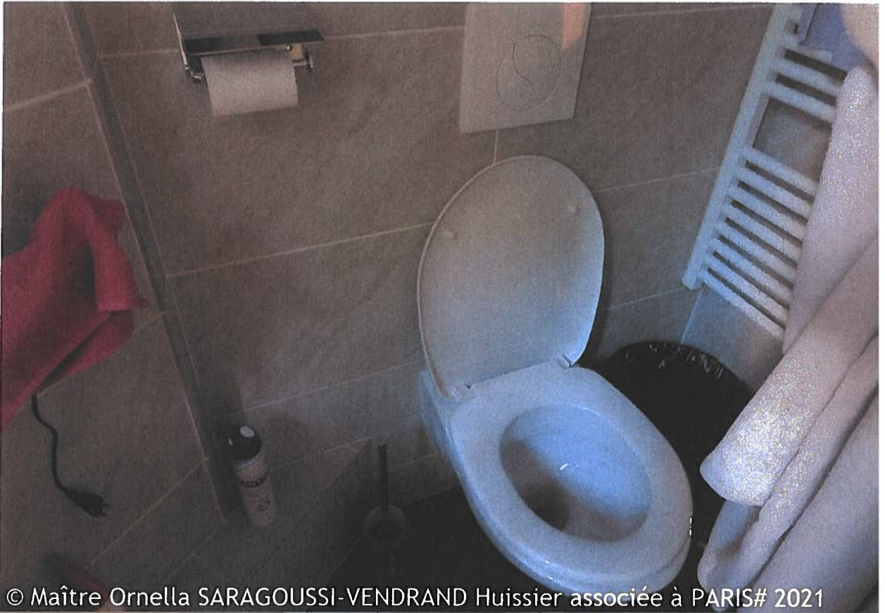
© Maître Ornella SARAGOUSSI-VENDRAND Huissier associée à PARIS# 2021