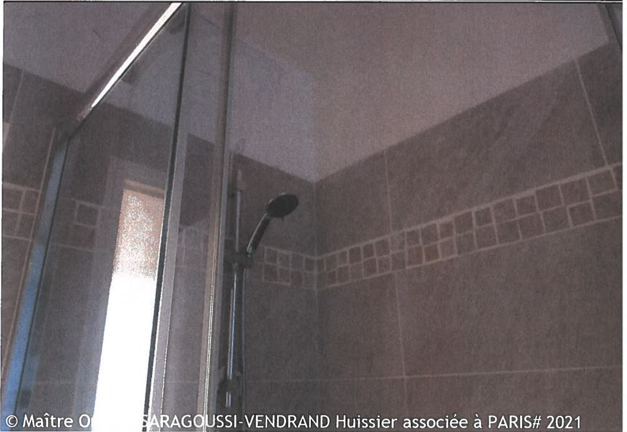
© Maître Ornella SARAGOUSSI-VENDRAND Huissier associée à PARIS# 2021