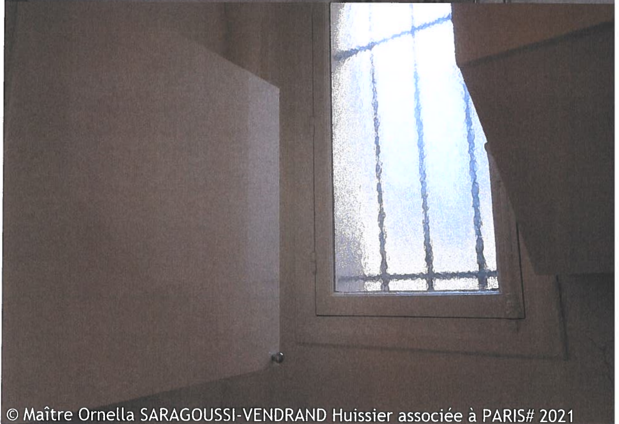
© Maître Ornella SARAGOUSSI-VENDRAND Huissier associée à PARIS# 2021