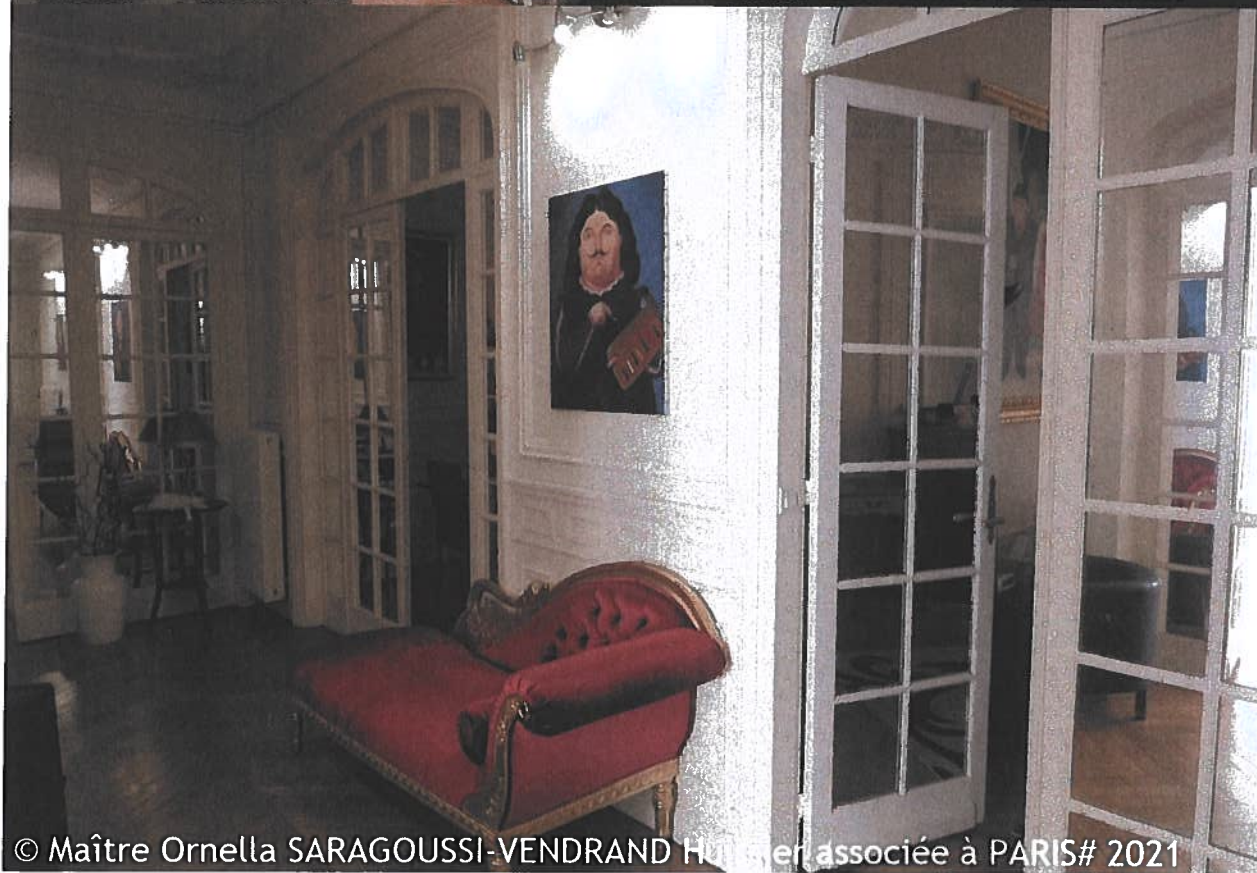
© Maître Ornella SARAGOUSSI-VENDRAND Huissier associée à PARIS# 2021

Ornella SARAGOUSSI-VENDRAND Huissier de Justice 8 rue de Ventadour 75001 PARIS