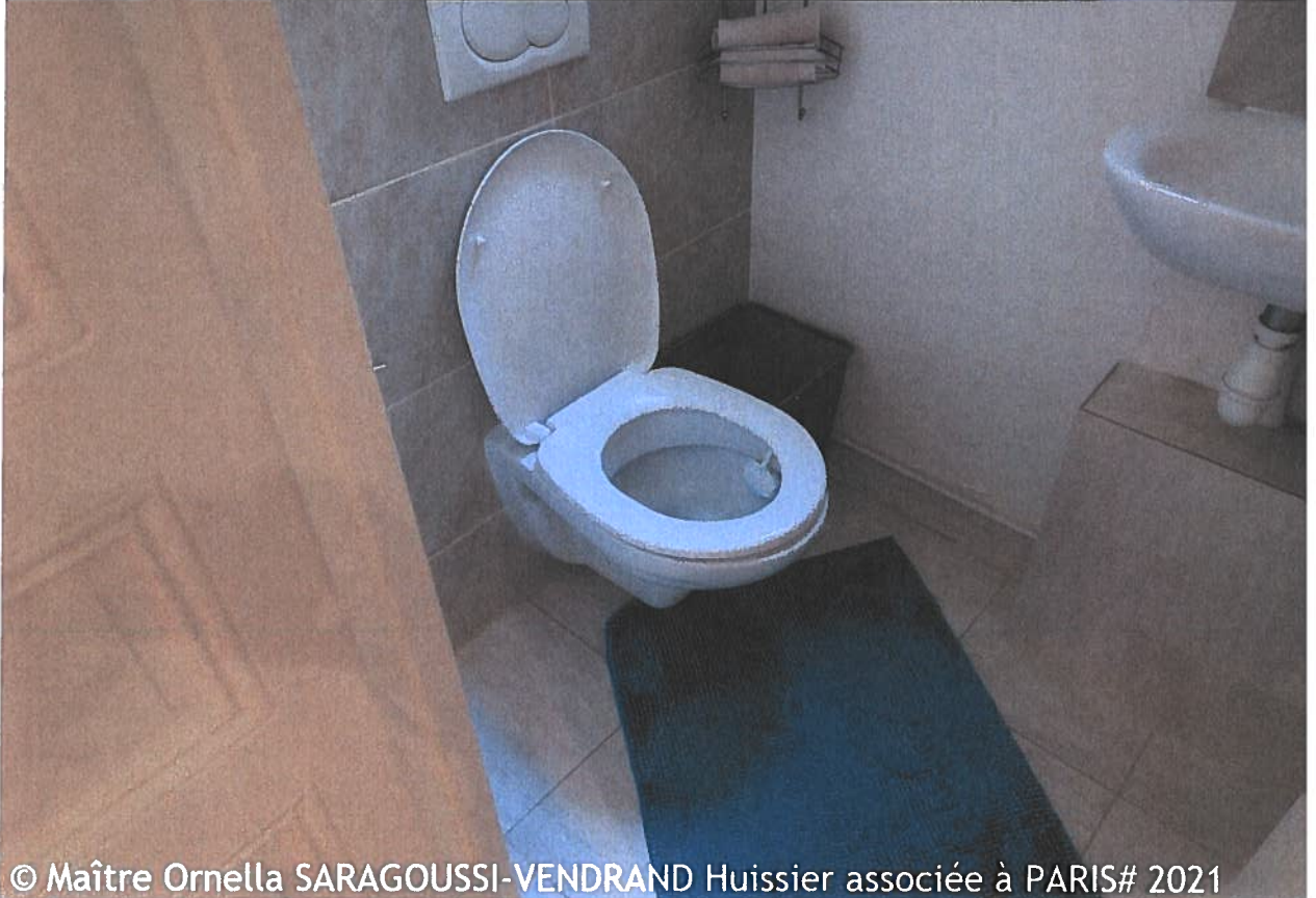
© Maître Ornella SARAGOUSSI-VENDRAND Huissier associée à PARIS# 2021