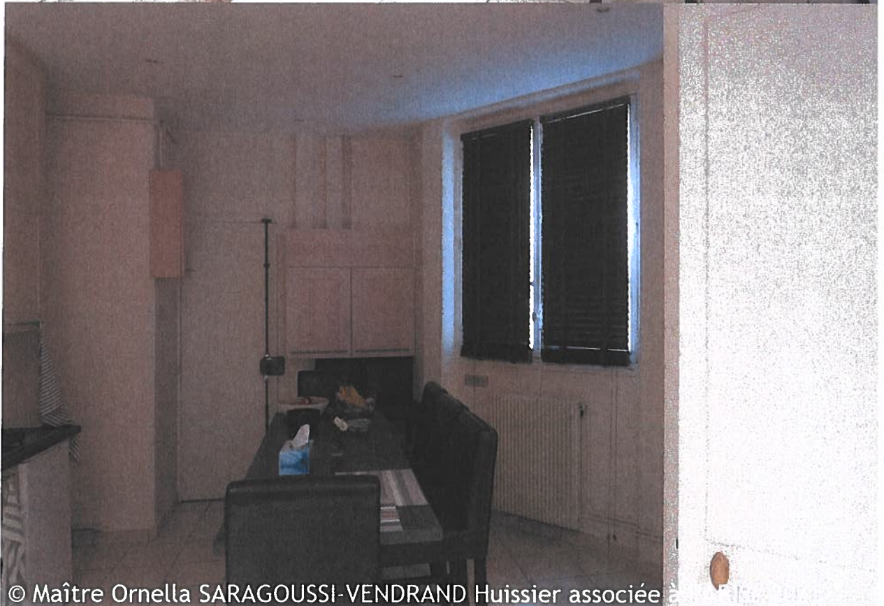
© Maître Ornella SARAGOUSSI-VENDRAND Huissier associée à PARIS# 2021

Ornella SARAGOUSSI-VENDRAND Huissier de Justice 8 rue de Ventadour 75001 PARIS