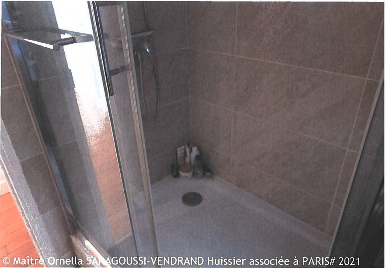
© Maître Ornella SARAGOUSSI-VENDRAND Huissier associée à PARIS# 2021