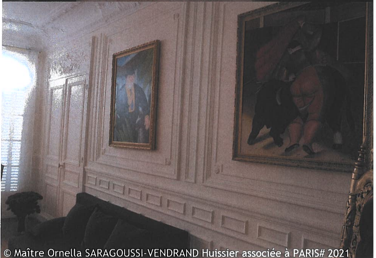
© Maître Ornella SARAGOUSSI-VENDRAND Huissier associée à PARIS# 2021