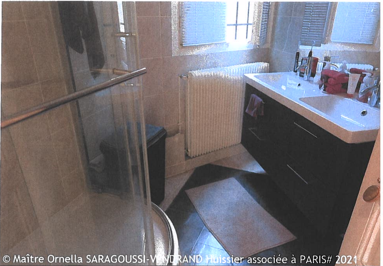
© Maître Ornella SARAGOUSSI-VENDRAND Huissier associée à PARIS# 2021