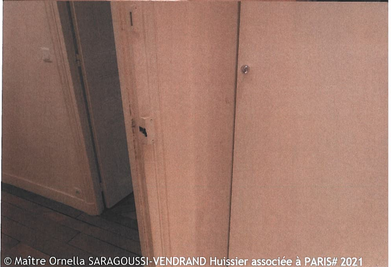
© Maître Ornella SARAGOUSSI-VENDRAND Huissier associée à PARIS# 2021