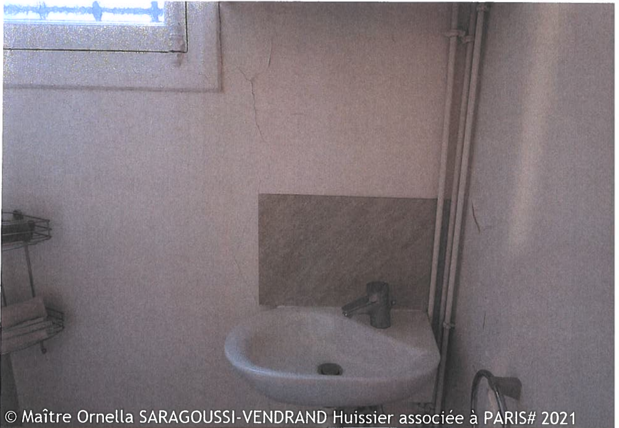
© Maître Ornella SARAGOUSSI-VENDRAND Huissier associée à PARIS# 2021