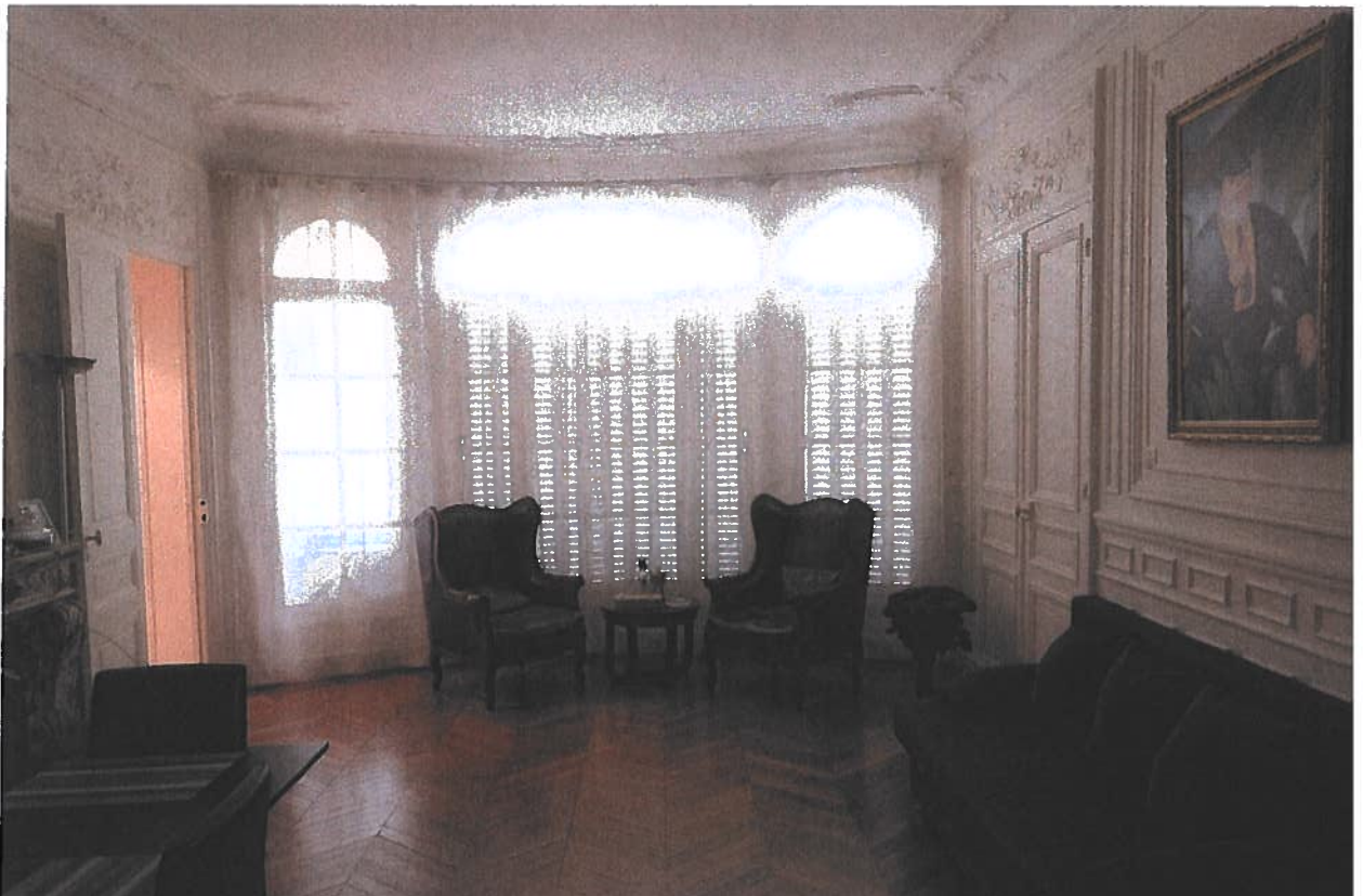
© Maître Ornella SARAGOUSSI-VENDRAND Huissier associée à PARIS# 2021