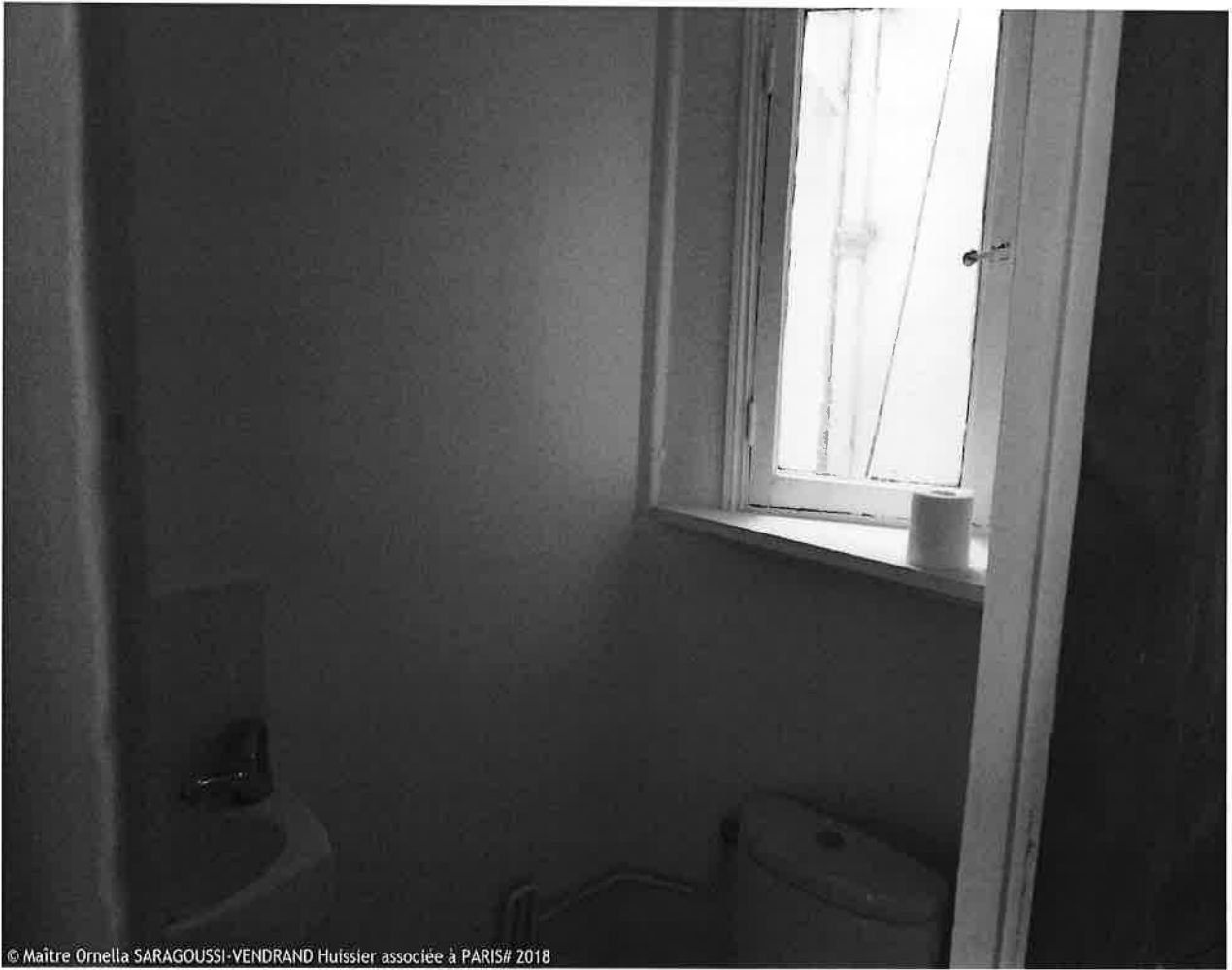
© Maître Ornella SARAGOUSSI-VENDRAND Huissier associée à PARIS# 2018

Ornella SARAGOUSSI-VENDRAND Huissier de Justice 8 rue de Ventadour 75001 PARIS