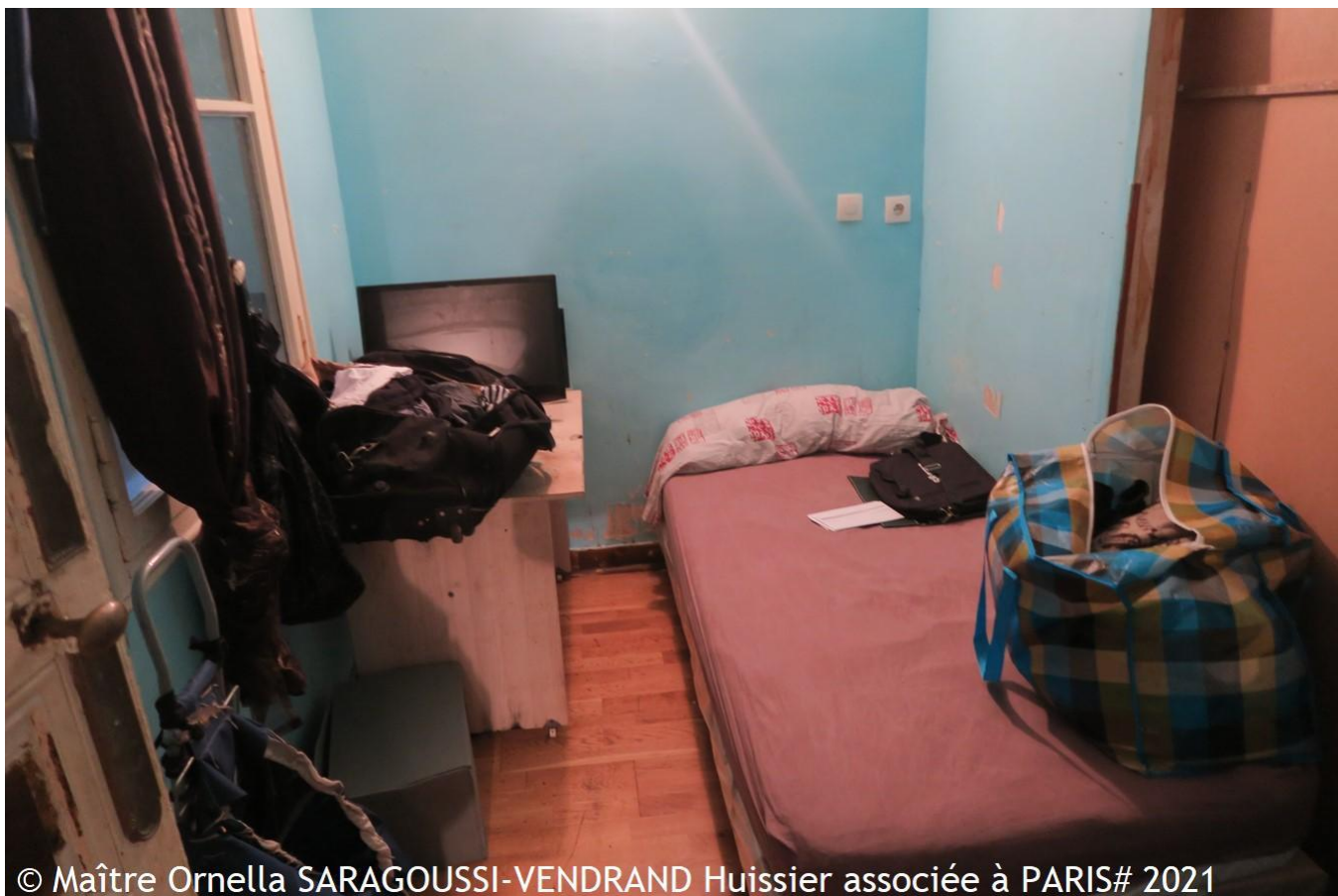
© Maître Ornella SARAGOUSSI-VENDRAND Huissier associée à PARIS# 2021