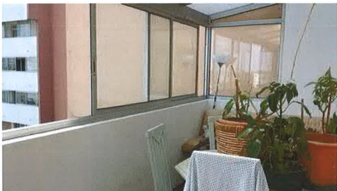
Vue depuis la loggia :